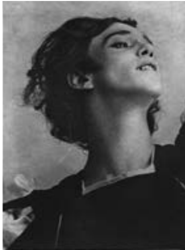
ABB 1 Nijinsky als Albrecht in Giselle ; ABB 2 Mathilde Kschessinskaja; ABB 3 Igor Strawinsky, Waslaw Nijinski als Petruschka, Kostüm von Alexandre Benois; ABB 4 Nijinski in Spèctre de la rose , Kostüm von Léon Bakst