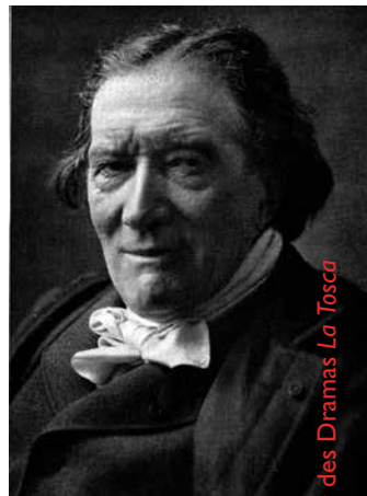
Victorien Sardou (1831 – 1908), Autor des Dramas La Tosca

Giacomo Puccini an seinen Freund und Verleger Giulio Ricordi Paris, 13. Januar 1899